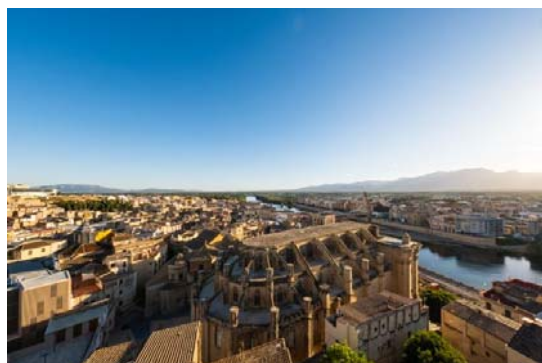
Catedral de Tortosa

Organitzen aquestes jornades la Secció Filològica de l'IEC i l'Ajuntament de Tortosa, amb la col·laboració de la Fundació Bancària La Caixa.