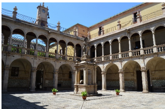
Claustre de l'IEC, Barcelona

Atesa la rellevància dels actes preparats, és la voluntat de l'organització poder comptar amb la presència dels agents socials, culturals i polítics del territori. Els organitzadors agraeixen la participació i el suport que han rebut de destacades institucions i personalitats.